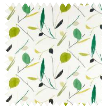
Estampado abstracto. Con algún toque negro, algodón Oxalis , de Scion, en 1,37 m (71,50 €/m). Distribuye Pepe Peñalver.