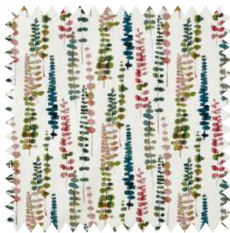
Estampado acuarelado. De la colección Cuba , de la firma Coordonné, algodón Trinidad Guava ; en 2,80 m (65,83 €/m).