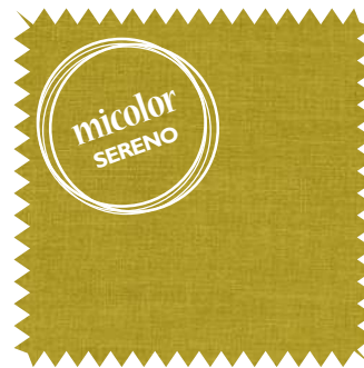
En tono ciruela amarilla, para contrastar con los verdes. Tela Biarritz , de Camengo, en poliéster y algodón; en 3 m (67,90 €/m).