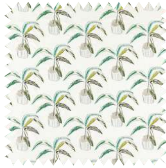
Patrón con plantas. En poliéster, algodón y viscosa, tela Crassula , de Scion; en 1,30 m (90,90 €/m). Distribuye Pepe Peñalver.