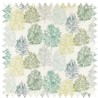
Un bosque oriental. Algodón Soetsu , de la firma Scion; en 1,37 m de ancho (60,50 €/m). Distribuye Pepe Peñalver.