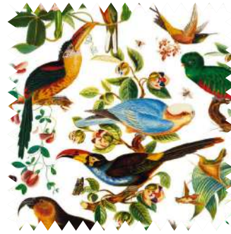
Aves exóticas. Algodón Oaxaca , de la colección Nuevo Mundo , de Gastón y Daniela, en 1,36 m de ancho (129,08 €/m).