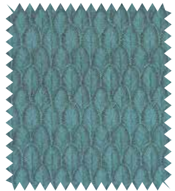
Hojas de palmera. Jacquard Palmette , de la firma Pierre Frey, con fibra de poliéster Trevira; en 1,30 m de ancho (113 €/m).