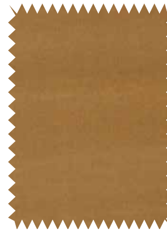
Color camel. Algodón Kelway Velvet , de Threads, de venta en Gastón y Daniela; en 1,40 m de ancho (117,07 €/m).