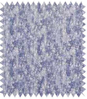
Azul violáceo, en degradé. Tela de la colección Native , de Casadeco, mezcla de poliéster y lino; en 3 m (73,15 €/m).