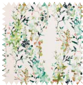
Glicinia trepadora. Algodón flamé Hana Eden, de la firma Romo, muy suave al tacto; en 1,36 m de ancho (50,63 €/m).