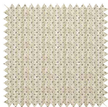
Moteado. Modelo Coralite, de Harlequin, en viscosa, poliéster y algodón; en 1,43 m (95,47 €/m). Distribuye Fabric Editors.

La paleta cromática otoñal clásica aumenta. Los editores textiles también presentan tapicerías neutras. Crema, arena, marfil, hueso, piedra... son además elegantes. Aquí, los linos Tokio y Mayan, de Coordonné, en beis claro, ganan luminosidad con los motivos blancos; en 1,44 m (57,27 €/m).