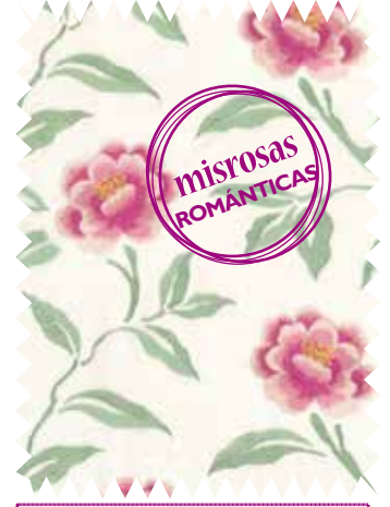
Motivos bordados. Flores Pivoine , de Camengo, en lino y algodón; para confección y cortinas, en 1,29 m (103,50 €/m).