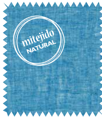
Visillo stonewashed. Lino Pondichéry , de Élitis; en 2,85 m (115,80 €/m). Disponible en 32 colores. Distribuye Le Mûrier