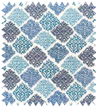
Motivos bordados. Diseño Siola , de Designers Guild, en Usera Usera, mezcla de poliéster, lino y algodón; en 1,36 m (229 €/m).