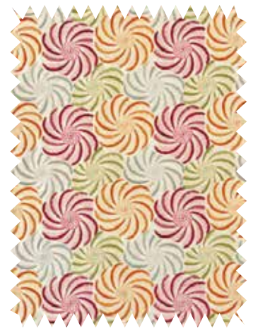
Molinillos. Bordado Rufolo , de Designers Guild, en Usera Usera, en viscosa y seda; para cortinas y confección, en 1,36 m (249 €/m).