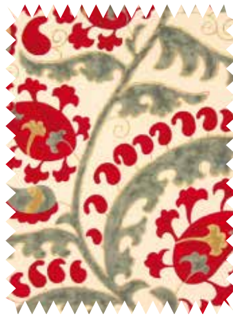
Inspiración étnica. Estampado Madrás , de KA International, para cortinas y confección, en algodón y lino; en 1,40 m (47,35 €/m).