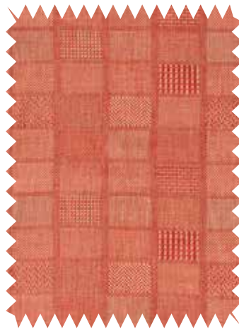
Mix & match. Diseño Montefalco , de Nina Campbell, en algodón, viscosa y lino; en 1,32 m (125 €/m). Distribuye Osborne & Little.