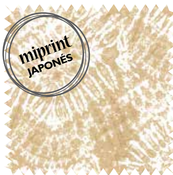
Shabori. Inspirado en esta técnica japonesa de teñido, lino de la colección Adire, de Alhambra; en 2,90 m/ancho (71,5 €/m).