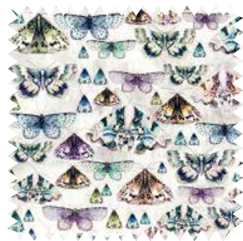
Mariposas multicolor. Modelo Issoria, de Designers Guild, en Usera Usera; mezcla de algodón y viscosa; en 1,37 m (176 €/m).