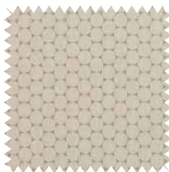
Círculos bordados. Tapicería Enso Chambray, de la firma Romo, mezcla de viscosa y lino; en 1,30 m de ancho (53,13 €/m).