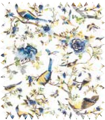
Estampado naif. Modelo Perdana , de Nina Campbell, en algodón y lino; en 1,51 m (122 €/m). Distribuye Osborne & Little.