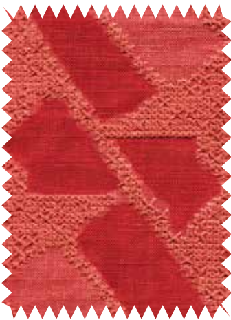
Bordada. Tela Essaouira , de Élitis, para cortina y confección, en algodón, viscosa y lino. En 1,30 m (196,50 €/m). Distribuye Le Mûrier.