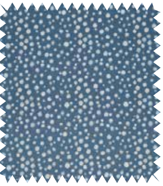
Lunares a la tiza. Modelo Mottle , de Harlequin, en poliéster, viscosa y lino; en 1,44 m (82,16 €/m). Distribuye Fabric Editors.