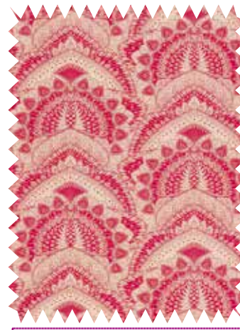
Estampado de luxe. Tapicería Azari , de Matthew Williamson para Osborne & Little, en lino y algodón; en 1,40 m (89 €/m).

¿Buscas una paleta otoñal con presencia? Apuesta por las tapicerías en cualquier rojo intenso; caldean el ambiente. Colección Sojourn , de Sanderson, en Gancedo: paisley Jamila , en lino y algodón (128,99 €/m).