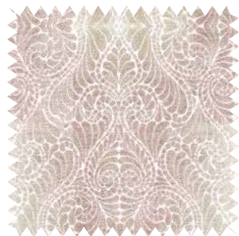
Chenilla con motivos clásicos. Tapicería Zoe 09 SR, de KA International, mezcla de poliéster y algodón; en 1,40 m (41,60 €/m).